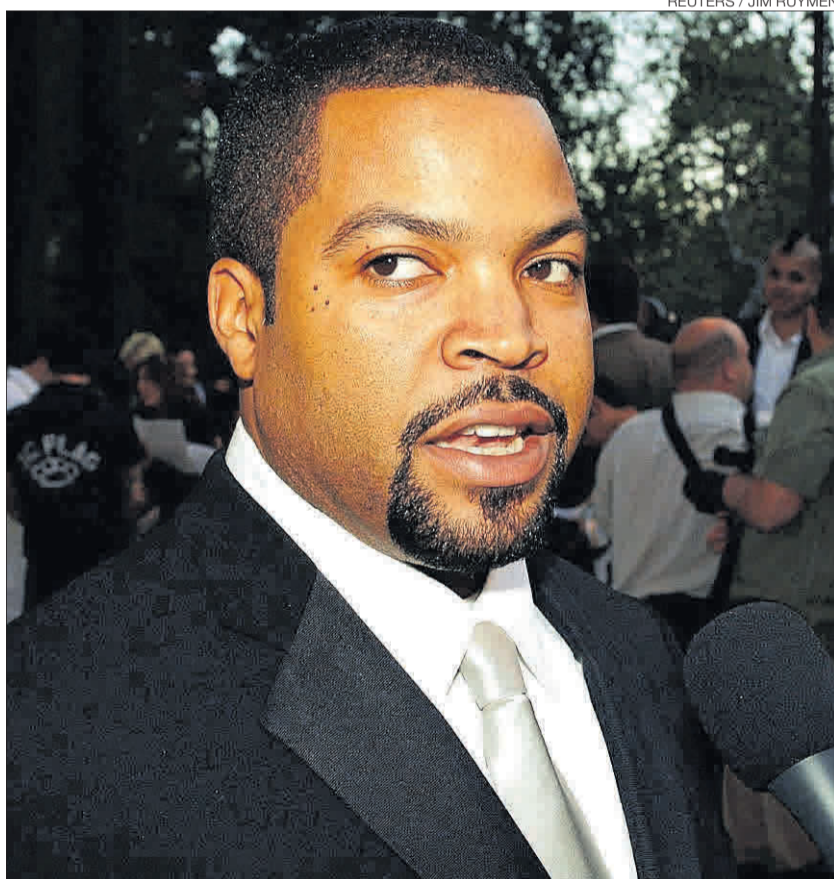
►► Ice Cube ► Uno de los raperos que se han inspirado en 'Scarface'.

Z , Mobb Deep , Biggie Smalls , Ice Cube , Lil Wayne ... Y, por supuesto, el rapero Scarface .